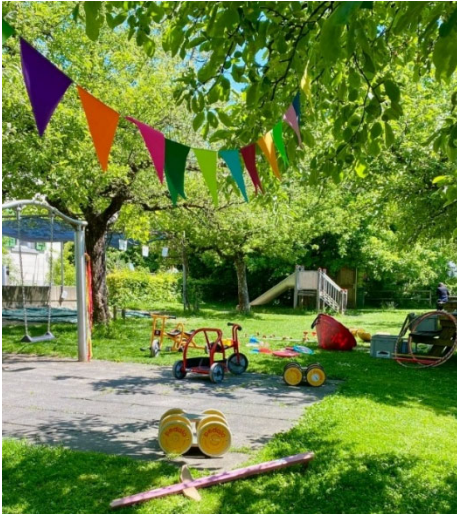
Das Spielmobil zu Besuch im Garten des Quartierhaus – auch ein Kinderflohmi fand statt

Zum ersten Mal drehte das Spielmobil des GZ Schindlergut seine Runde im Garten des Quartierhaus Kreis 6. An drei Nachmittagen verwandelte sich der lauschige Garten in ein buntes Kinderparadies: Es wurde gespielt, gelacht und Glacé geschleckt. An einem der Nachmittage fand trotz wechselhaftem Wetter ein Kinderflohmarkt statt der sehr gut besucht wurde. Der Funke hat zündet: Im Jahr 2026 kommt das Spielmobil wieder, diesmal im Juni.